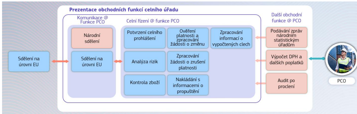
Schéma znázorňuje funkce systému EU pro centralizované řízení při dovozu, fáze 1.