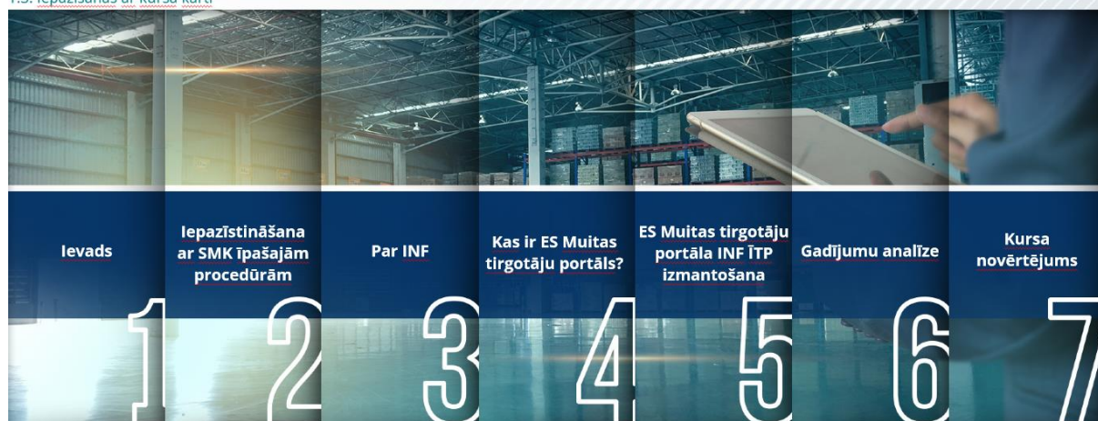
1.3. Iepazīšanās ar kursa karti

Kursa karte ļauj viegli piekļūt kursa galvenajām sadaļām. Kursa karte ir ērti novietota horizontālajā rīku joslā augšpusē.