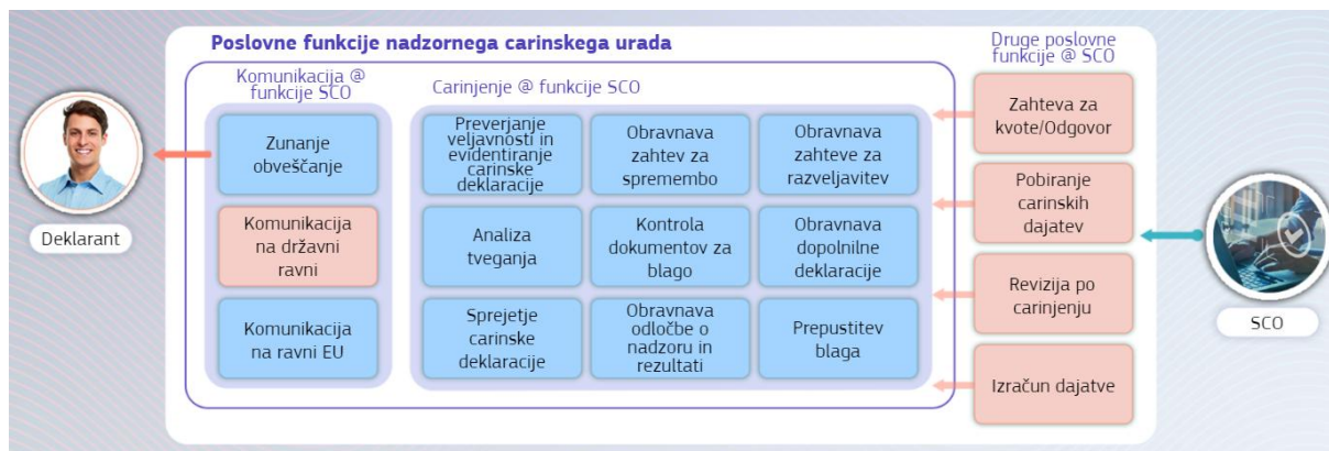
Diagram predstavlja funkcionalnosti sistema centraliziranega carinjenja za uvoz v okviru EU, 1. faza.